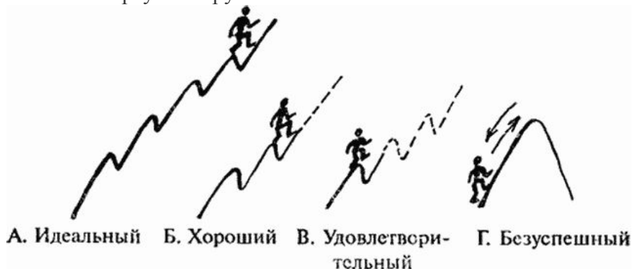
Рис. 5. Жизненный путь человека

➤ Всегда ли ошибки, совершенные человеком, дают ему жизненный опыт? ➤ В сочинении, которое напишете дома, вы будете рассуждать о ценности духовного и практического опыта Фомы Гордеева, о наставлениях отца, крёстного, о цене ошибок главного героя на пути приобретения жизненного опыта.